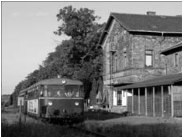
Schienenbus bei Göllheim-Dreisen

Die in der Fahrplantabelle R57 „E“ gekennzeichneten Eilzüge („Felsenland-Express“) werden mit dem historischen Esslinger-Dieseltriebwagen VT452 der Albtalbahn von 1958 gefahren, einem wahren Schmuckstück in rotem Lack und noch mit originalen Holzbänken, hauptuntersucht im Jahre 2010. Es gelten die Verbundtarife von VRN und KVV sowie das Rheinland-Pfalz- und Schönes-Wochenende-Ticket! Bitte beachten Sie, dass der VRN-Tarif im Felsenland-Express nicht zwischen Karlsruhe Hbf und Würth gilt!