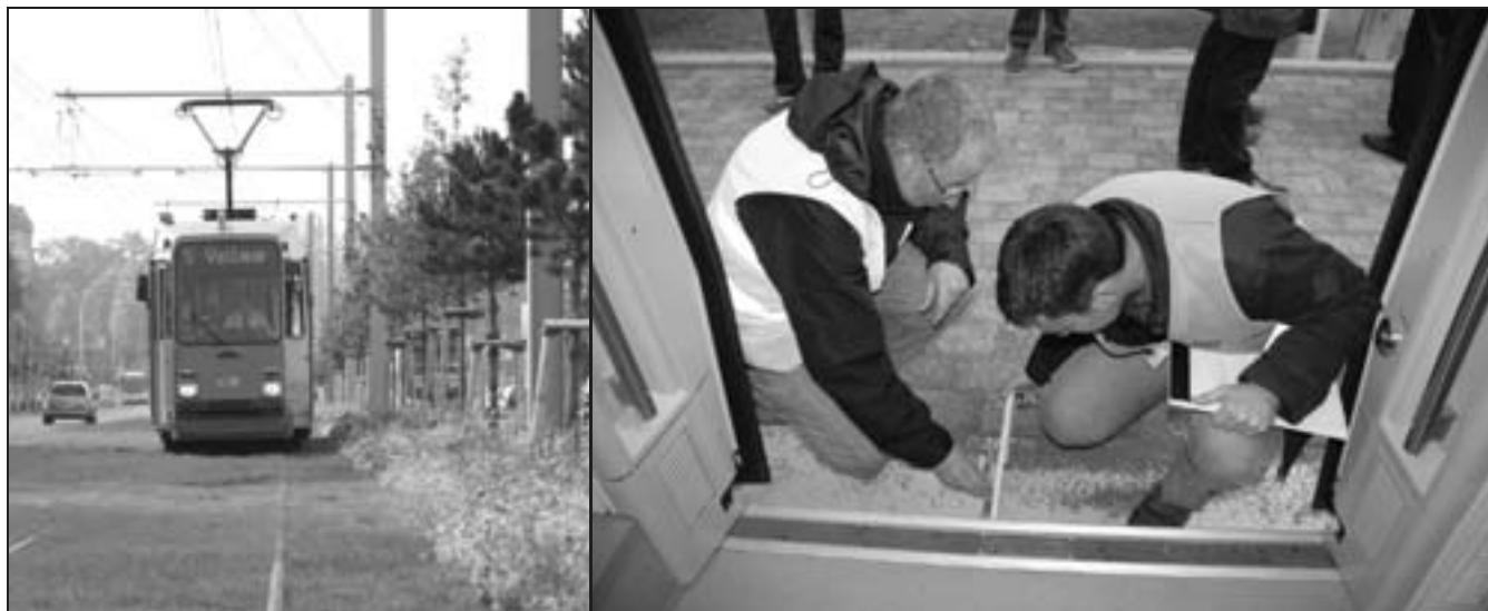
Rasengleis nach Vellmar (li.). Passt: Immer wieder vermessen Bauleute die Abstände (re).

betriebenen Regiotram auf den neuen Schienen, da zu dieser Zeit die Fahrleitungen noch nicht in Betrieb waren. (hh/wb)