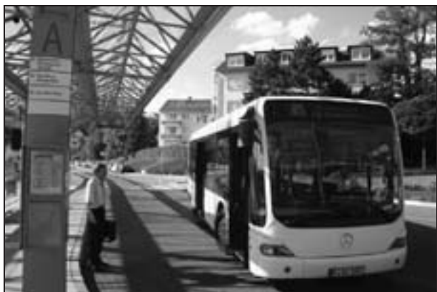
Ehemaliger Kronberger Cito beim zeit- aufwändigen Fahrerwechsel am Bahnhof Königstein.

In Königstein kommt der Straßenverkehr rund um den Kreisel dreimal täglich während der Hauptverkehrszeiten praktisch zum Erliegen. Dies ist allen Verkehrsplanern hinlänglich bekannt. Liniensbusse benötigen während dieser Stauzeiten für eine Strecke von üblicherweise vier Minuten bis zu zwölf Minuten. Erschwerend kommt in den ersten Tagen nach dem kleinen Fahrplanwechsel hinzu, dass der PKW-Schleichweg über die Stresemannstraße wegen Bauarbeiten unpassierbar war. Die gleichzeitige Freigabe der unteren Adelheidstraße für den Gegenverkehr hat sich allerdings, entgegen in der Presse geäußelter negativer Befürchtungen, sogar in gewissem Maße als verkehrsentlastend erwiesen.