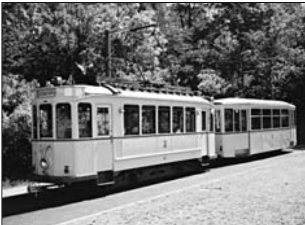
Triebwagen Nr. 57 mit Beiwagen, Baujahr 1925

des Straßenbahnbetriebs. Mit der sogenannten Brandnacht am 11. September 1944 und der Zerstörung der Darmstädter Innenstadt kam der Betrieb nahezu völlig zum Erliegen. Erst nach Kriegsende wurden die Strecken nach und nach wieder in Betrieb genommen.