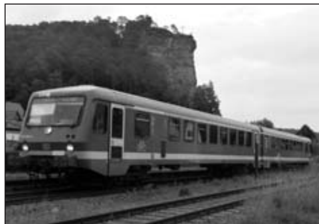
Der „Bundenthaler“ bei Dahn.

Am Wochenende 17./18. September 2011 wird das Jubiläum „100 Jahre Wieslauterbahn Hinterweidenthal – Bundenthal-Rumbach“ gefeiert, unter anderem sind Dampfsonderzüge geplant. Informationen werden noch auf der Internetseite www.wieslauterbahn.com veröffentlicht. Ansonsten wird die Strecke Hinterweidenthal Ost – Bundenthal-Rumbach im Ausflugsverkehr an Samstagen und Sonntagen bis 2. Oktober 2011 sowie am Feiertag 3. Oktober 2011 befahren.