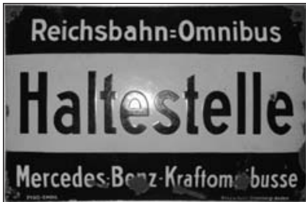
Schon 1924 gab es Fernbusse der Deutschen Reichsbahn

Entwicklung der Fernbuslinien ab Berlin und der wenigen anderen Fernbuslinien hat gezeigt, dass der Fernlinienbus nicht Konkurrent des Fernverkehrs der DB ist, sondern die Mitfahrzentralen konkurrenzieren wird.