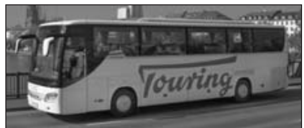
Bus der Deutschen Touring.

Bisher hat sich die Genehmigungspraxis der zuständigen Landesbehörden mit der extensiven Auslegung des Begriffs „Verkehrsbedürfnis“ geholfen, wenn die jeweiligen Landes-Verkehrsministerien die Auslegung geduldet oder gefördert haben. Vor allem die Neuen Bundesländer haben die Auslegung sehr liberal gehandhabt, aber nicht nur dort: Das Regierungspräsidium Darmstadt hatte entschieden, dass eine Fernbuslinie Dortmund – Köln – Frankfurt, die zu niedrigen Preisen die Relation abdeckt, zu konzessionieren sei, da das Verkehrsbedürfnis der preis-, aber nicht zeitsensiblen Kunden von der DB (bewusst?) nicht abgedeckt würde.