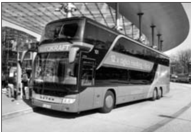
Auch die Bus-Tochter Autokraft der Deutschen Bahn betreibt Fernbuslinien nach Berlin.

Nennenswerte Überschneidungen im Marktsegment Fernreisen bestehen für die Fernbuslinien Berlin – Hamburg und Berlin – Dresden, wo DB Fernverkehr und BLB unmittelbar konkurrieren, beide jedoch ihr gutes Auskommen haben. Andere BLB-Linien von Berlin nach „Westdeutschland“ sind von der Fahrzeit her keine Konkurrenz zu DB-Fernverkehr, oder sie steuern umsteigefrei Kur- und Erholungsorte an, die auf der Schiene keine umsteigefreien Verbindungen mit Berlin (mehr...) haben, z.B. Bad Kissingen oder Zwiesel, wohin es zu Zeiten der „Beamtenbahn“ noch Kurswagen gab.