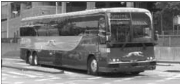
Vorbild Greyhound-Bus in den USA