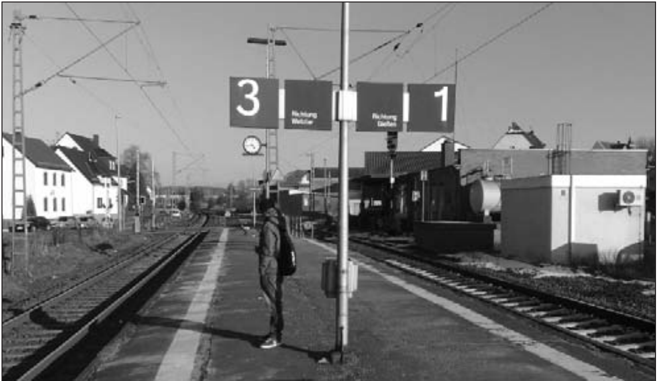
Dutenhofen, der einzige Bahnhof zwischen Gießen und Wetzlar.