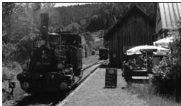
Kuckucksbähnel in Elmstein

Nach einem durchwachsenen Sommer 2011 hoffen wir auf einige schöne Herbsttage und -Wochenenden. Was liegt da für Eisenbahnfans näher, als einen Ausflug mit der Bahn auf reizvollen Nebenstrecken mit nostalgischen Zügen zu planen? Im Bereich des Verkehrsverbundes Rhein-Neckar (VRN) locken vier Bahnstrecken mit historischen Fahrzeugen, eine Strecke mit Dampfzügen, drei Strecken mit alten Dieseltriebwagen oder Schienenbussen. Die Anreise ist mit Fahrausweisen des VRN möglich, alle Fahrpläne sind in den Fahrplanbüchern des VRN oder auf der Internetseite http://fahrplanauskunft.vrn.de