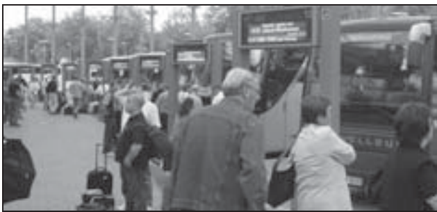
Zentraler Busbahnhof in Hamburg

sche Bahn und die Deutsche Touring, wenn nicht die privaten Busunternehmer endlich anfangen zu kooperieren. Ob die Ankündigungen von Veolia, in den Markt einzusteigen, belastbar sind, wird sich auch erst herausstellen müssen; Veolia ist bisher überwiegend als Meister im Ankündigung Nicht-Einhalten in Erscheinung getreten. Gleichwohl, stoppen und umkehren lässt sich der Trend nicht. Aber vielleicht im Sinne der Fahrgäste mitgestalten?