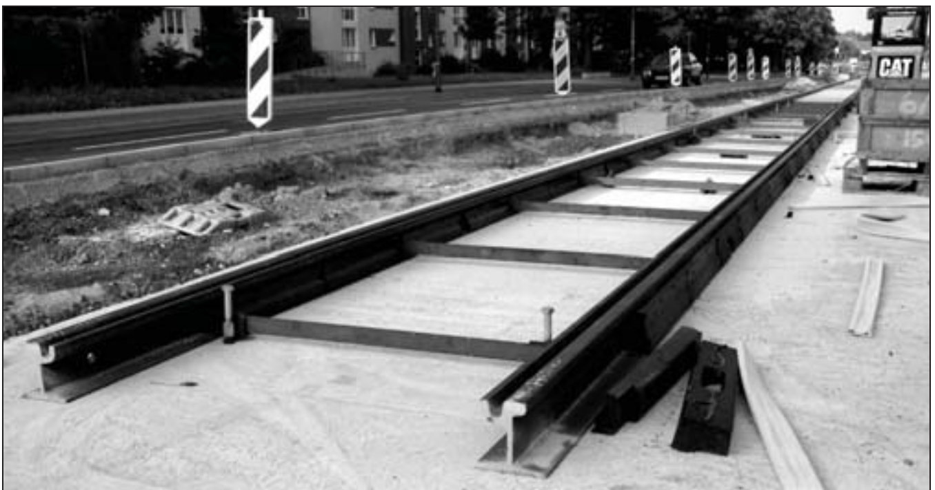
Feste Fahrbahn in der Friedberger Landstraße