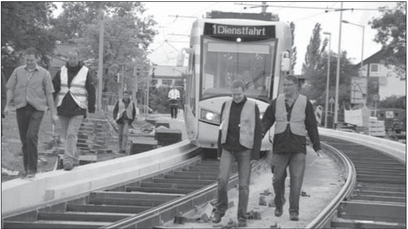
Probefahrt mit einer dieselgetriebenen Regiotram am 30. Juli in Vellmar.