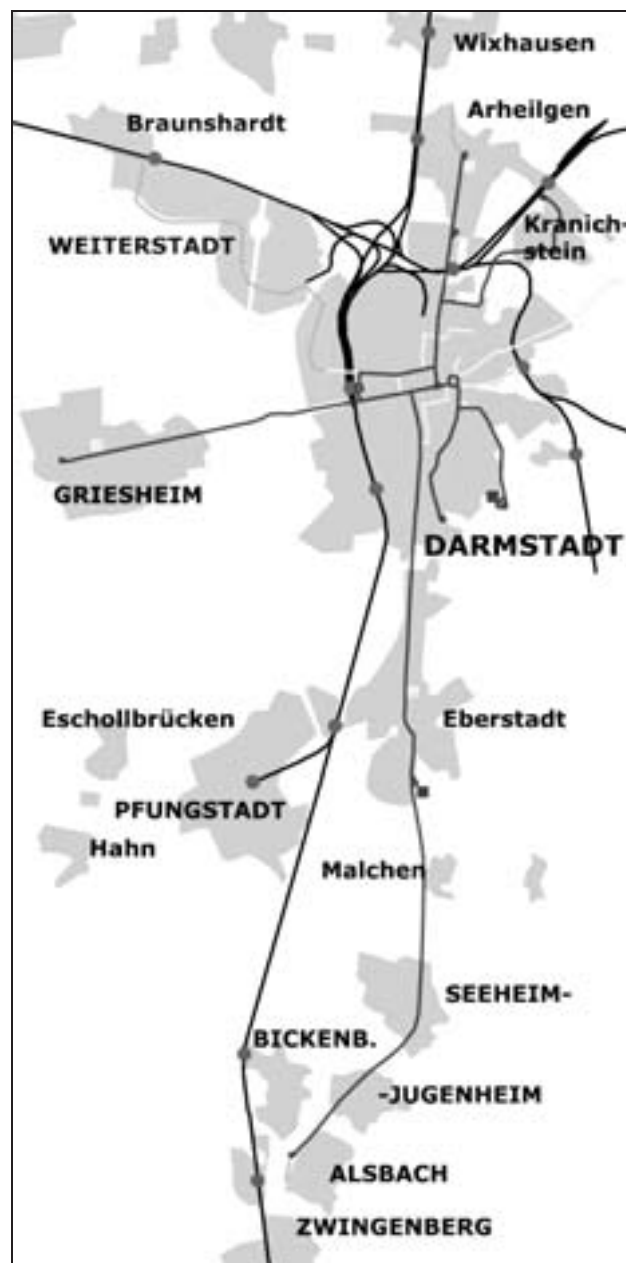
Das Darmstädter Schienennetz – Meter- und Normalspur. (Karte: Daniel Jünger)

wie die Aufnahme des Personenverkehrs in die Waldkolonie/Rodensteinweg. Trotz der Bevorzugung des Omnibusses im Dritten Reich gelang es der HEAG 1936 die Überlandstrecke von Eberstadt über Seeheim bis nach Jugenheim zu bauen.