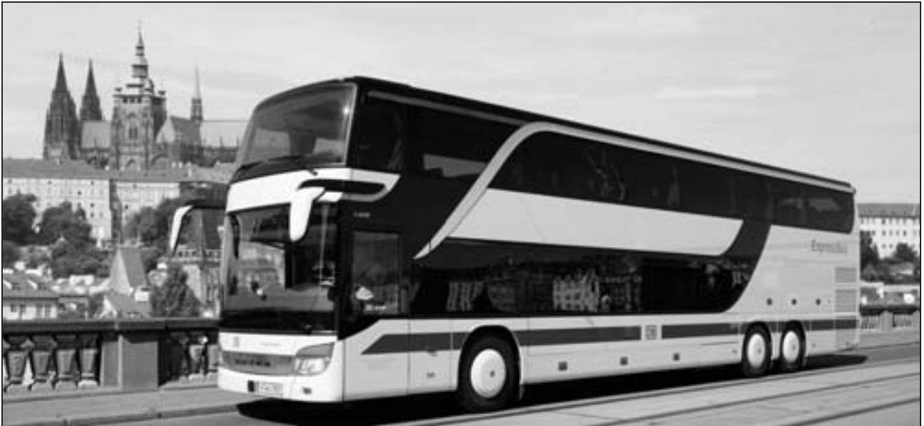
Fahrzeug der Omnibusverkehr Franken in Prag.

Der Grund für dieses – im Vergleich mit (ost-)europäischen Nachbarländern bescheidene – Angebot an Fernbuslinien dürfte bekannt sein, es sind die – noch – geltenden Beschränkungen durch das Personenbeförderungsgesetz von 1938, das zum Schutz der Eisenbahn Buslinien nur zugelassen hat, wenn erstere dem Verkehrsbedürfnis nicht entsprechen konnte. Ein klassisches Monopolschutzgesetz, das eigentlich nicht mehr in die heutige Zeit passt – sollte man meinen. Weit gefehlt!