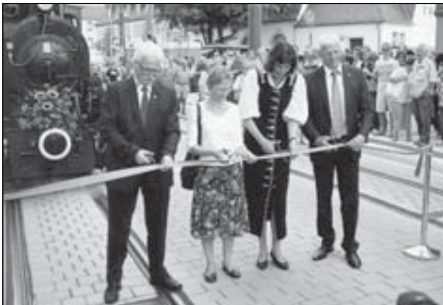
Offizielle Eröffnung am Löwenplatz in Arheilgen.

Zuletzt folgte nun am 6. August 2011 die Verlängerung dieser Strecke an den Arheilger Nordrand mit einer Festveranstaltung und Freifahrten auf dem neuen Abschnitt. Nach Norden hin werden zwei neue Stationen Messeler Straße und Kolpingweg bedient, bevor die neue Endstation Dreieichweg erreicht ist. Hier ist eine großzügige Umsteigeanlage zu den weiterführenden Buslinien nach Wixhausen und Neu-Isenburg entstanden; Fahrgäste können im Regelfall direkt am gleichen Bahnsteig umsteigen.