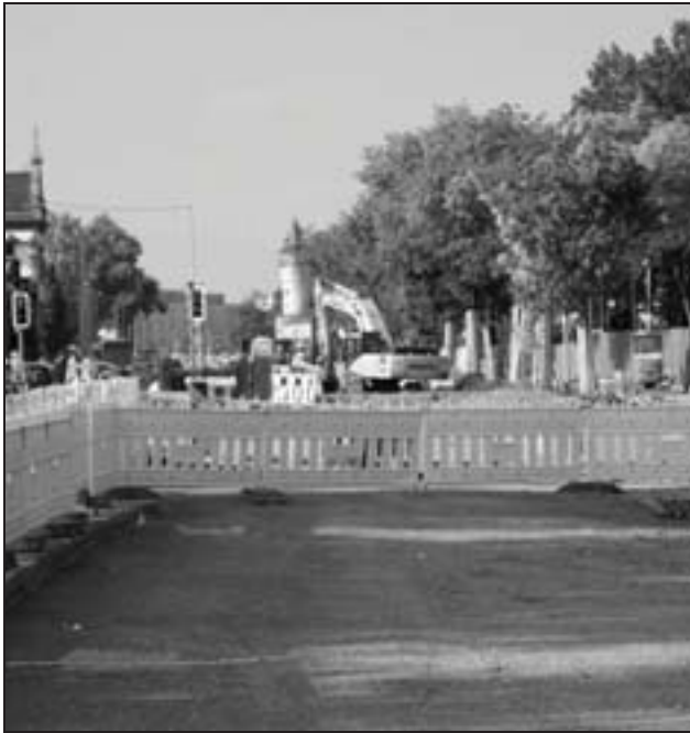
Friedberger- Ecke Münzenbergerstraße

In der Hauptverkehrszeit wird die Tram alle zehn Minuten verkehren, in den Randzeiten ist ein 20-Minuten-Takt für die pro Tag prognostizierten 15.000 Fahrgäste vorgesehen. Vorrangschaltungen und die gemeinsame Nutzung der asphaltierten Trasse von Bahn und Bus entlang der Friedberger Landstraße sollen kurze Fahrzeiten und Pünktlichkeit garantieren. Anzeigen mit dynamischen Fahrgastinformationen an den Haltestellen werden die Fahrgäste dazu stets auf dem Laufenden halten.