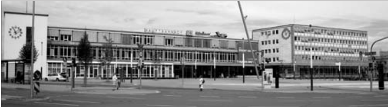
Der Kasseler Hauptbahnhof soll auch ausgebaut werden.

Im Bereich des RMV gibt es bisher lediglich für den Bahnhof Frankfurt-Höchst einen Maßnahmenkatalog und einen Fertigstellungstermin (Dezember 2015). Die Kosten werden mit rund 10 Millionen Euro veranschlagt. ( Wilfried Staub )