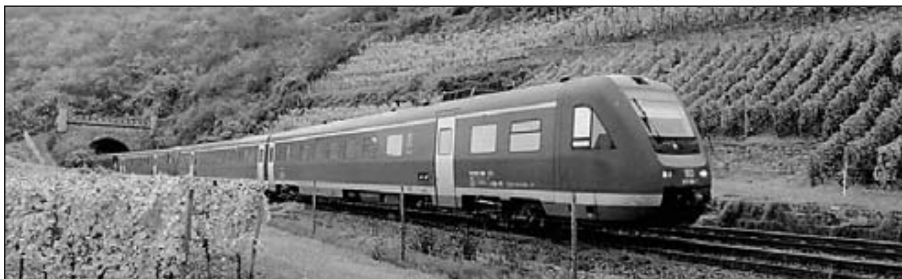
Zug der Baureihe 612 („Pendolino“) auf der Nahstrecke