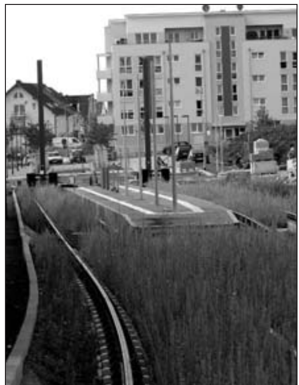
Haltestelle am Gravensteiner Platz mit üppigem Rasengleis.

Die Haltestellen „Nibelungenplatz/Fachhochschule“, „Münzenberger Straße“, „Wasserpark“, „Friedberger Warte“, „Bodenweg“ und „Gravensteiner Platz“ baut die VGF mit 60 Meter langen Bahnsteigen, zur gemeinsamen Nutzung mit den Bussen der Linie 30. Die Stationen „Walter-Kolb-Siedlung“ und „Alkmenenstraße“ werden exklusiv der Tram vorbehalten und daher mit nur 35 Meter langen Bahnsteigen ausgestattet.