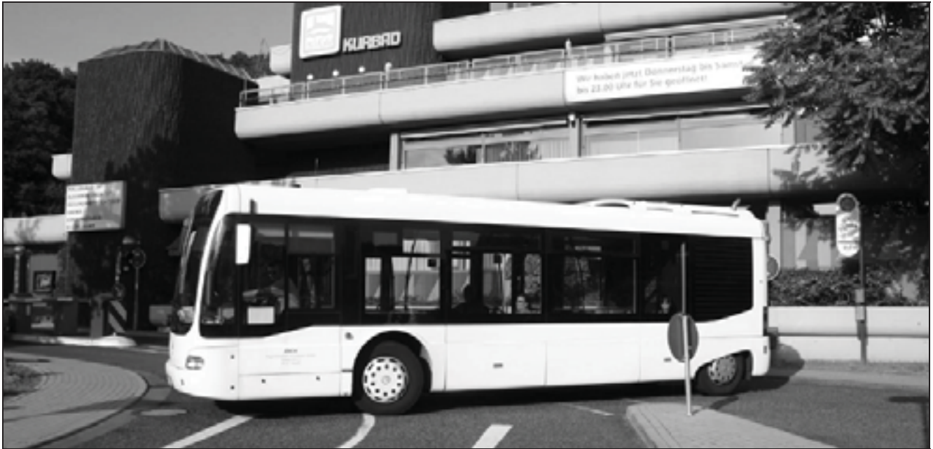
Rückstoßmanöver an der provisorischen Haltestelle am Kurbad.