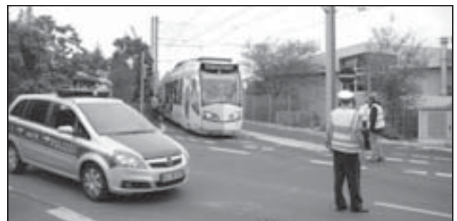
Die Polizei sichert die erste Probefahrt.

alle 7,5 Minuten verkehren, außerhalb der Hauptverkehrszeiten fahren die Bahnen wochentags im Viertelstunden-Takt.